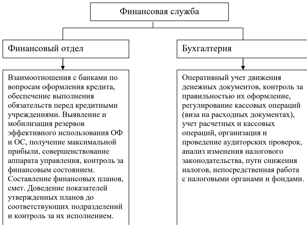
Рисунок 2 – Функциональная структура финансовой службы ООО «Интернет Решения»

Выполняя свои главные задачи в области управления финансами финансовые службы организации могут исходить из разной мысли управления.